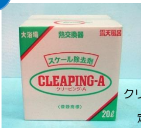
クリーピングA 20L 定価：17,500円