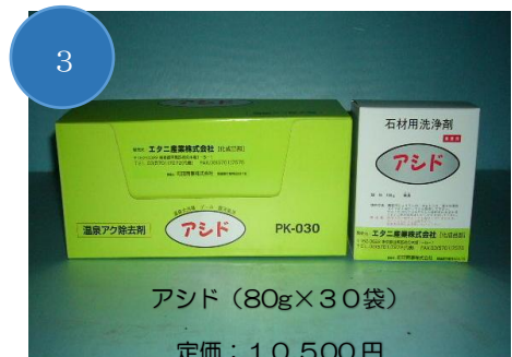
アシド (80g×30袋) 定価：10,500円