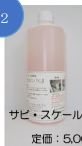
サビ・スケール取り 1L 定価：5,000円