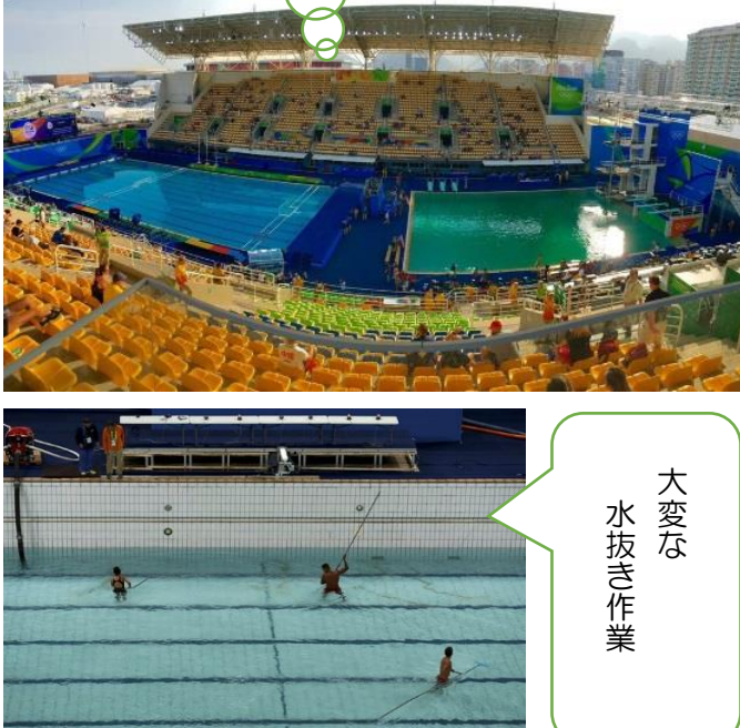
大変な 水抜き作業